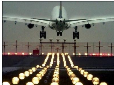
Infrastrukturnutzung Entgelte 3,2 Mrd. €