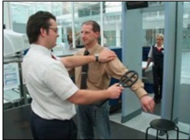
Passagierkontrollen LuSi-Gebühren 800 Mio. €