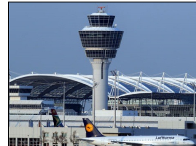
Flugsicherung FluSi-Gebühren 1,2 Mrd. €